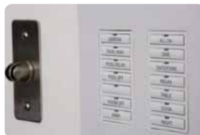
Obr. 6.: Jednoduché ovládanie pomocou predprogramovaných tlačidiel

Inteligentné kúrenie sa skladá z 25 zón podlahového vykurovania, vyhrievania domu a vnútorného bazéna, štyroch domácich zásobníkov na teplú vodu a vyhrievané sušiče na uteráky v kúpeľniach a spálňach. Teplo dodávajú dva plynové kotly, ktoré pracujú podľa požiadaviek jednotlivých služieb vykurovania.