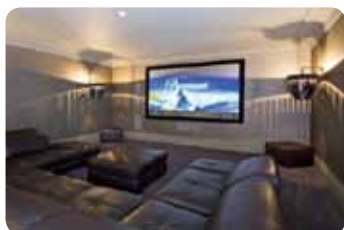
Obr. 3.: Domáce kino