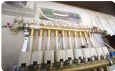
Obr. 7.: Ventilový rozvod pre podlahové kúrenie s akčnými členmi a regulátorom HVAC

Inštalácia systému Hometronic bola hračkou. Len čo technici dokončili kompletnú inštaláciu zariadení HVAC, rozvodných rúrok,