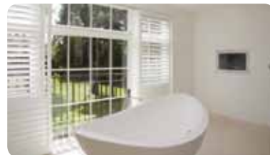
Obr. 4.: Systém inteligentného kúrenia zahŕňa podlahové vykurovanie a sušičky na uteráky v kúpeľniach a spálňach

podlahové vykurovanie, kotly, horúcu vodu a systémy klimatizácie. Systém Hometronic je schopný priniesť výrazné zlepšenia pre majiteľa domu z hľadiska komfortu aj úspor energie na úrovni až 30 %. Podobne ako AMX, aj systém Hometronic možno jednoducho prepojiť ako časť celého systému domovej automatizácie riadenej či už systémom Crestron, Netstreams alebo Pronto. K aplikácii Hometronic Manager možno prísť aj vzdialene prostredníctvom zabudovaných bezdrôtových technológií pomocou aplikácie WebManager alebo mobilným telefónom.