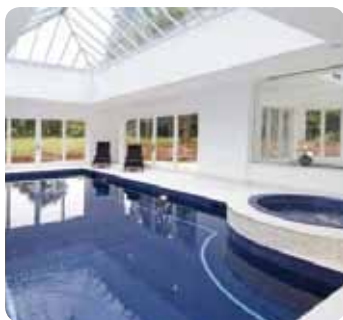
Obr. 1.: Priestor s bazénom

V opise projektu sa dodávateľská firma snažila poskytnúť kompletnú predstavu inteligentného domu a pri návrhu systémov bolo od začiatku zrejmé, že majiteľ má rád netradičné a nové technológie. Avšak spolu s rodinou si želal, aby bol systém jednoducho použiteľný, spoľahlivý, komfortný a estetický.