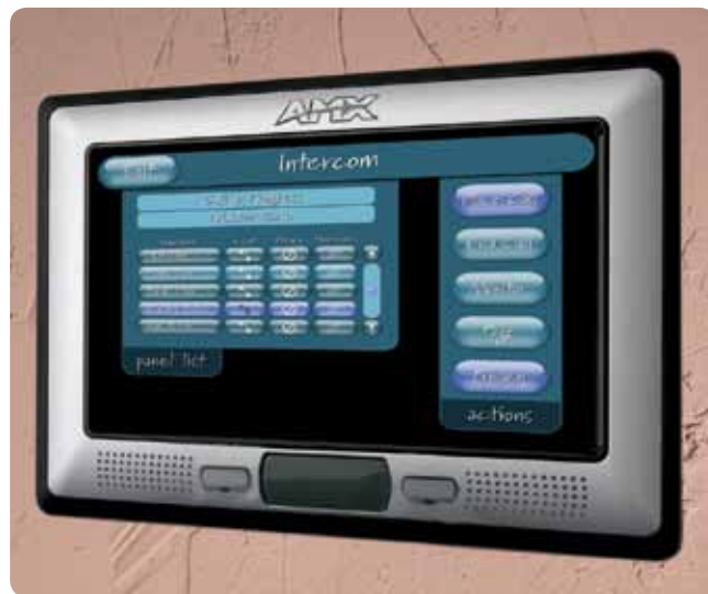
Obr. 5.: Dotykový panel AMX Modero

Inteligentné kúrenie sa skladá z 25 zón podlahového vykurovania, vyhrievania domu a vnútorného bazéna, štyroch domácich zásobníkov na teplú vodu a vyhrievané sušiče na uteráky v kúpeľniach a spálňach. Teplo dodávajú dva plynové kotly, ktoré pracujú podľa požiadaviek jednotlivých služieb vykurovania.